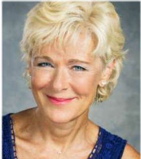
Dominique Demers

L'atelier s'adresse aux 5 e , 6 e années du primaire et aux élèves de 1 re secondaire (7 e année).